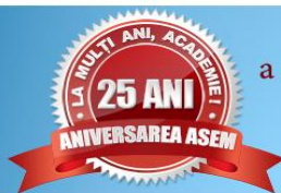
FOTO GALERIE a evenimentului, dedicat celei de-a 25-a aniversări a ASEM